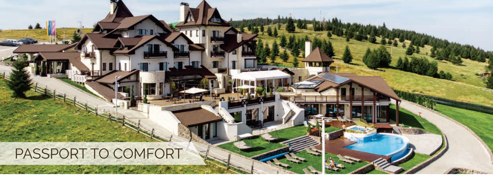
PASSPORT TO COMFORT